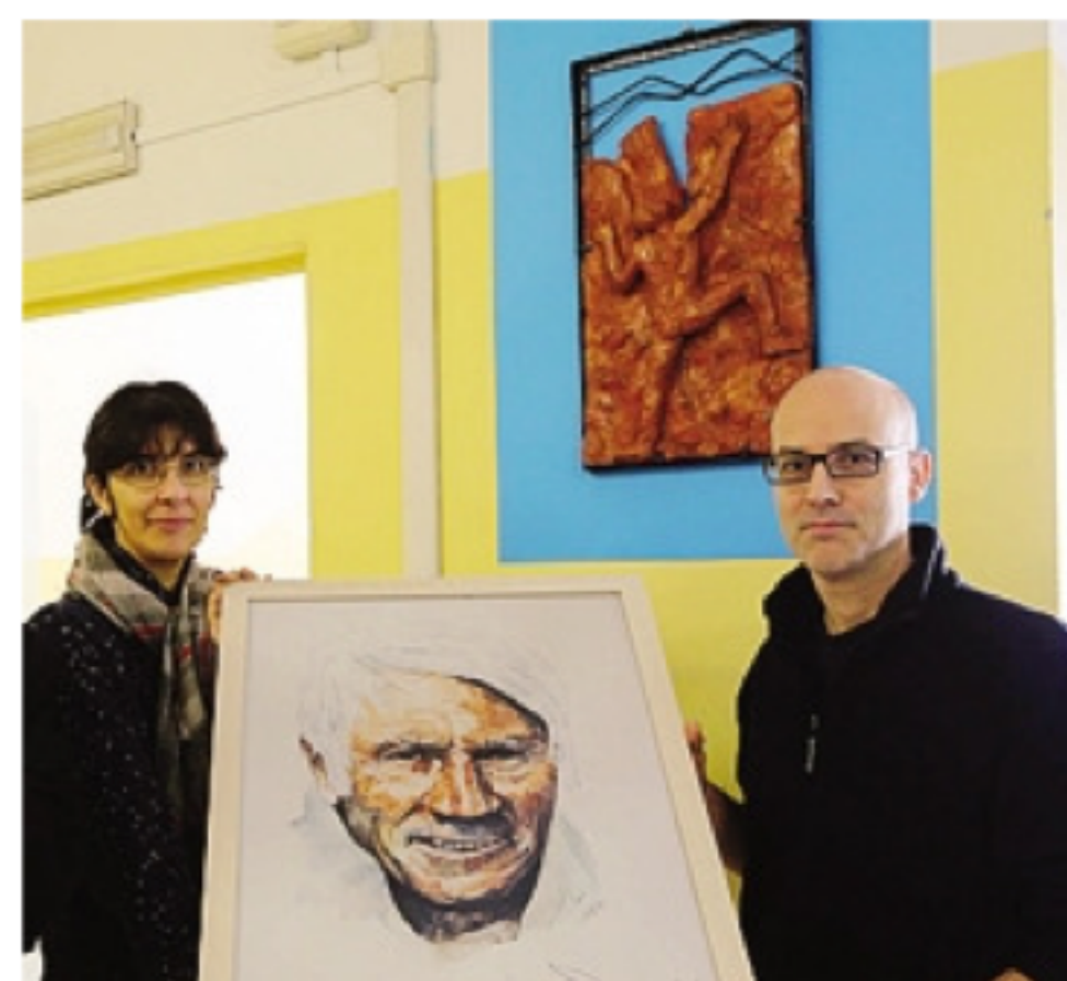
Due delle opere che raffigurano Bonatti installate nella scuola